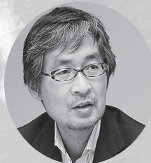
日本平和委員会常任理事