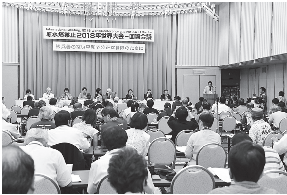
原水禁2018年世界大会国際会議（8月4日、広島市）

安倍首相は2017年の総選挙で、全国を次のように演説してまわった。「北朝鮮の危機がある中で、安保法を廃止すると言う人は、あまりにも無責任だ」。だが、いま次のように言葉をかえしたい。「北朝鮮の危機が解決に向かおうとする中で、安保法を維持すると言う人は、あまりにも無責任だ」。戦争法の廃止は、市民と野党の共闘の原点であるだけに、新たな構えで追及していきたい。 翁 おながたけし 長雄志前知事の遺志をうけつぐ たまき 玉城デニー新知事が誕生し、辺野古 へのこ の米軍新基地建設反対のたたかいも、いっそう重要となっている。