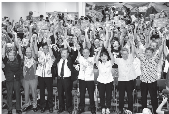
当選を喜ぶ玉城新知事と支援者たち（2018年9月30日）

今回の選挙は翁長知事の弔い合戦と言えるたたかいであり、翁長知事が命を懸けて創り上げようとした「平和で誇りある豊かな沖縄」を実現するたたかいであった。「平和」については言うまでもなく沖縄戦の悲劇を二度と繰り返さない事であり、「誇り」については祖国復帰をかちとった沖縄県民のたたかいを表している。「豊かな沖縄」とは「核も基地もない平和な沖縄」の実現のため県内移設反対、新基地建設阻止の民意を改めて示