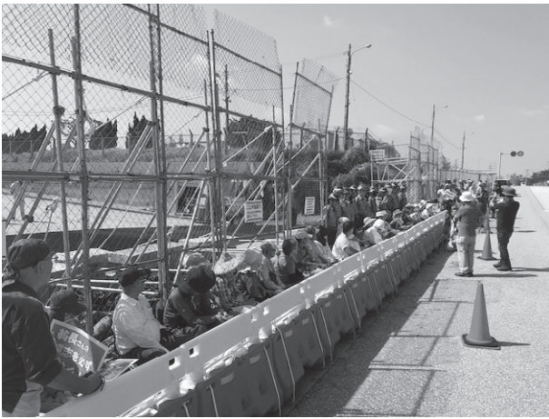
台風24号でフェンスの一部が破壊・撤去された辺野古の米軍キャンプ・シュワブ工事前での座り込み行動（2018年10月1日）