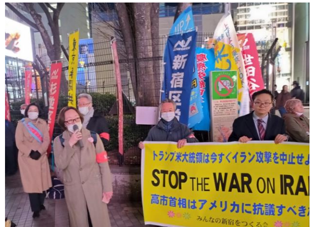
【写真左】2026 春闘勝利！3.12 春の北部共同行動（池袋）、【右】西部労働者アピール行動（新宿）