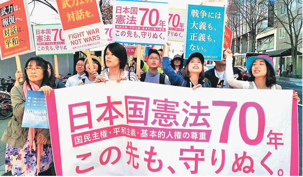
憲法施行70周年「安保関連法」廃止、「共謀罪」阻止！守ろう憲法集会（5月3日・北海道）