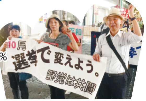
9条改憲NO！静岡での集会(9月19日)