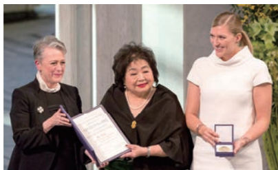
2017年12月10日 ノーベル平和賞授賞式

被爆国なのに、この条約への参加を否定する日本政府に、世界から批判の声があがっています。ノーベル平和賞を受賞したICANの一員で被爆者のサーロー・節子さんは「核兵器禁止条約と日本国憲法の力で平和と安全を守れる」と語り、この条約への参加を各国政府に求めています。