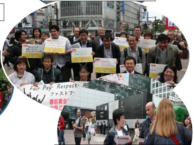
渋谷では道行く海外からの観光客も注目