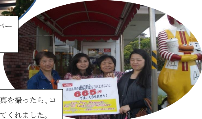
鹿児島では組合員がマックで写真を撮ったら、コーヒー代を補助して行動を拡げてくれました。