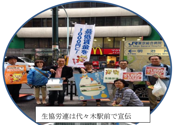
生協労連は代々木駅前で宣伝