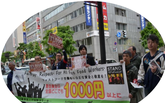
北海道ではマクドナルド労働者が手を振ってくれました