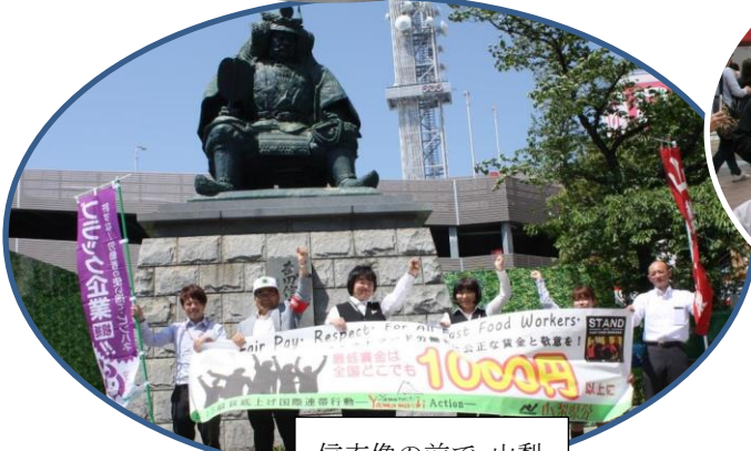
信玄像の前で 山梨