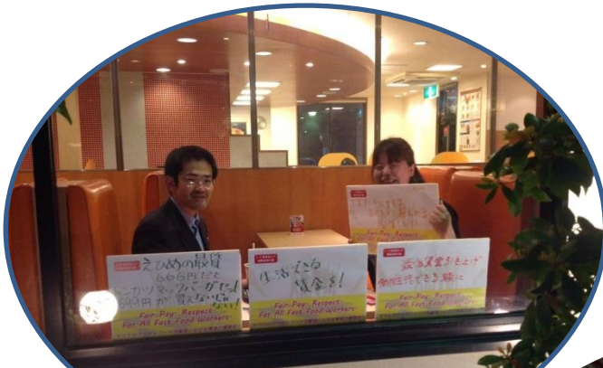
えひめの最賃 666円だとトンカツマックバーガーセット 699円が買えないじゃない!