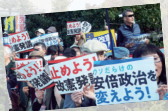
写真はすべて2018年11.3憲法集会