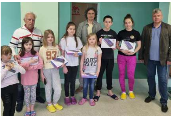
「ひまわり募金」に喜ぶリトアニアに避難しているウクライナの子どもたち