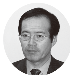
東京慈恵会医科大学教授