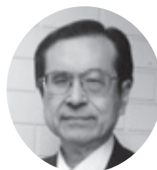
法政大学名誉教授