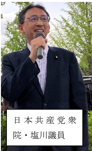
日本共産党衆 院・塩川議員

【1】昼休み国会前集会 12時～13時、参院第2議員会館前 【2】Twitter デモ 【3】マイナ保険証は全件チェックまで利用システム運用停止を！「全国一斉 ファックス行動」