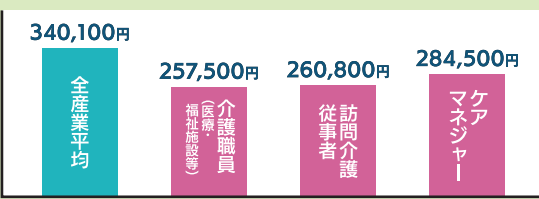
厚生労働省：「令和4年賃金構造基本統計調査」一般労働者の毎月決まって支給される現金給与額(時間外手当、深夜・休日・交替手当などを含む。税・社会保険料控除前)

介護労働者の賃金は、他産業と比べて低賃金に据え置かれ続けています。全産業平均より月約7万円も低いなか、月6,000円、2.5%のベースアップ(定期昇給分含め平均約12,000円)程度では他産業との賃金格差は埋まりません。これでは、生活は成り立たず、人手も減る一方です。