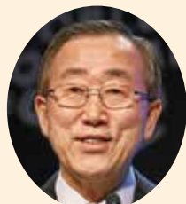
潘 基文 国連事務総長