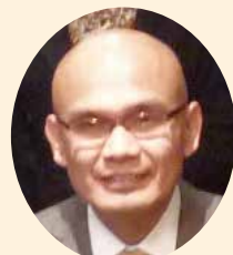
デスラ・プルチャヤ インドネシア大使