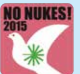
大会記念バッジ (頒価310円)