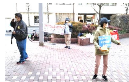
写真上から、東海地本の自治体要請、群馬支部あゆみ分会のスタンディング、岩手福祉労組の街頭宣伝、福岡地本杉の子保育園分会のメッセージ、神奈川県本部の宣伝行動