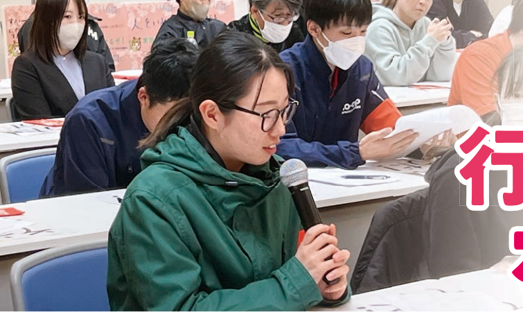
わかやま市民生協労働組合の団体交渉